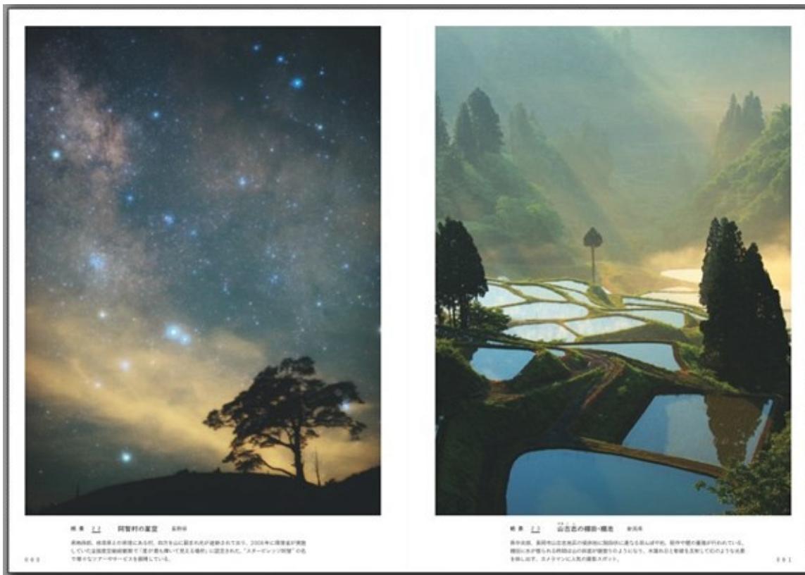
左：阿智村の星空（長野県） 右：山古志の棚田・棚池（新潟県）