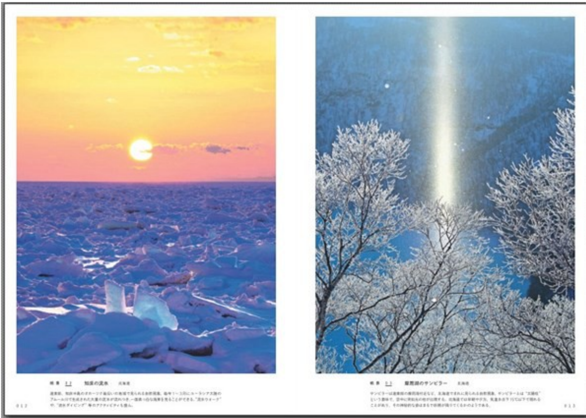
左：知床の流氷（北海道） 右：摩周湖のサンピラー（北海道）