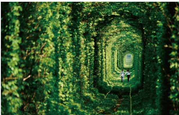
写真 11 クレヴァニ 恋のトンネル ウクライナ

天門山ロープウェイ(中華人民共和国) ブルーモスク(トルコ) なばなの里(三重県) 三游洞 絶壁レストラン(中華人民共和国) パーテルスウォルトセ湖(オランダ) ワカチナ(ペルー) ニュルンベルクのクリスマスマーケット(ドイツ) サンミシェルデギレ礼拝堂(フランス) シャウエン(モロッコ) フリヒリアナ(スペイン) ランタンフェスティバル(台湾) 河内藤園(福岡県) アイスホテル(スウェーデン) ブルーラグーン(アイスランド) ナヴァイオビーチ(ギリシャ) ラントヴァッサー橋(スイス) カッパドキア(トルコ) ヤムドゥク湖(中華人民共和国) モラヴィア(チェコ) 九寨溝(中華人民共和国) 竹田城跡(兵庫県) モンキーポッド(アメリカ、ハワイ諸島) 角島(山口県) パゴダ(ミャンマー) 南極のオーロラ(南極大陸) サンタクロース村(フィンランド) セノーテキル(メキシコ) 真名井の滝(宮崎県) 湯西川温泉(栃木県) チチカカ湖(ペルー・ボリビア) 玄海町(佐賀県) 富士山(山梨県・静岡県)