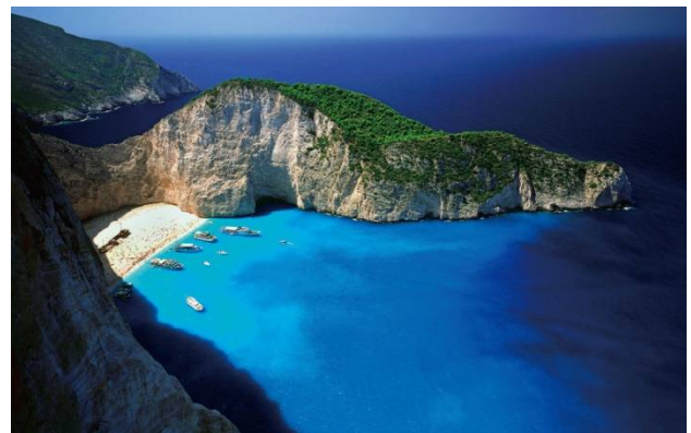
写真 12 ブルーラグーン アイスランド